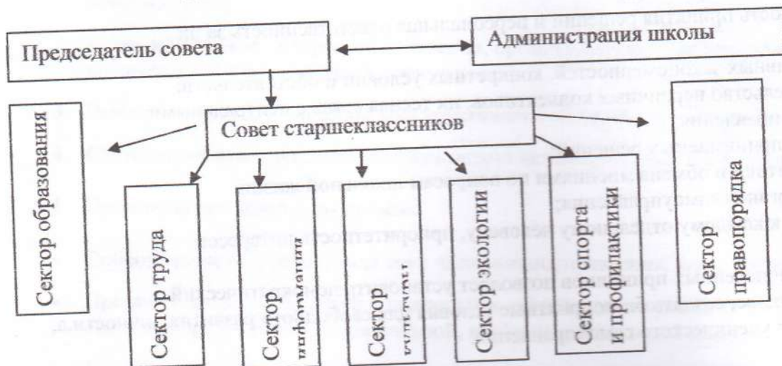
Структура школьного ученического самоуправления. Схема 1

Высшим исполнительным органом ученического самоуправления является