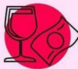
СТЕКЛО ИЛИ БУМАЖНЫЕ КУПЮРЫ 4 дня