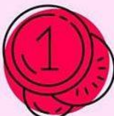
МЕДЬ до 4 часов