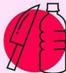
НЕРЖАВЕЮЩАЯ СТАЛЬ И ПЛАСТИК 3-7 дней