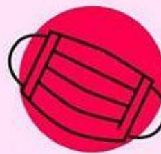
МЕДИЦИНСКАЯ МАСКА 7 дней

Чаще проводите дезинфекцию и мойте руки с мылом!