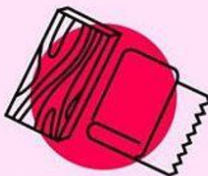
ДЕРЕВО И ТКАНЬ 2 дня