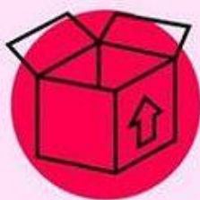
КАРТОН до 24 часов

Заразиться коронавирусом можно воздушно-капельным, воздушно-пылевым и контактным путем (через рукопожатия и прикосновения к предметам, на которых оседает вирус). При этом на каждой поверхности он сохраняется разное время.