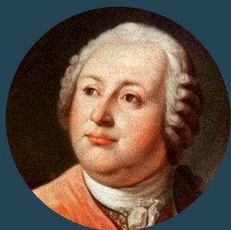
Михаил Васильевич Ломоносов

«Математику уже затем учить надо, что она ум в порядок приводит.»