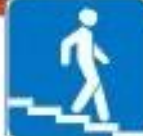
Знак "Подземный пешеходный переход"