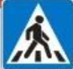
Знак "Пешеходный переход" обозначает место перехода пешеходом дороги

ПРАВИЛО 3: Подземный переход — самый безопасный!